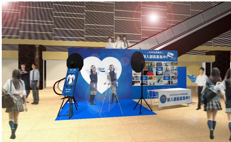
※画像はイメージです。実際の設置と異なる可能性がございます。

「ポカリ写真部」は、10代の方々が撮影した「自分らしい写真」を、SNS上で発信・共有する部活動として2022年2月に発足しました。今回の写真展では、2022年2月以降に投稿された部員の皆さまの作品4,186件(2022年6月12日時点)の中から厳選した186点を掲出します。