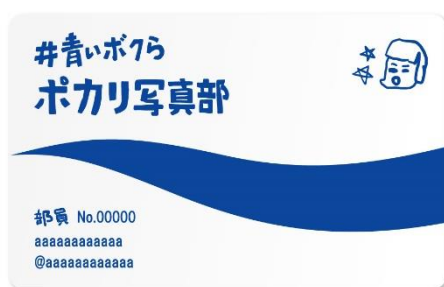
「ポカリ写真部」部員証