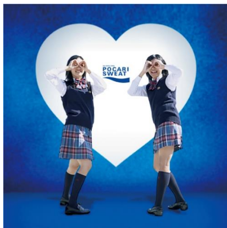
撮影写真イメージ

まるで写真館のような背景や椅子の置かれたフォトスペースで、自由に撮影いただけます。どなたでも無料で参加できます。撮影した写真は、撮影後発行される2次元コードレシートからダウンロードできます。