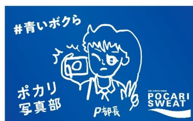
「ポカリ写真部」特製ステッカー