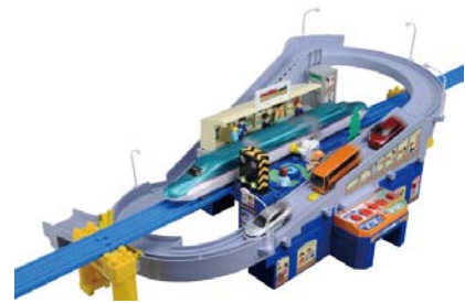
「トミカと遊ぼう！スーパーオートステーション」 *車両、トミカ、プラキッズ、レール、橋脚は別売りです。

【マニュアルモード】の場合、自分のボタン操作で車両の停車、発車をコントロールすることが可能です。