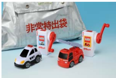
「ぐるぐるドライブ」

ボーイズ・トイ部門 大賞 プラレール「トミカと遊ぼう！スーパーオートステーション」