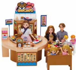
リカちゃん「くるくるかいてんずし」

ハイターゲット・トイ部門 優秀賞 「BM-01バスコレ走行システム 専用動力ユニットA」(株式会社トミーテック)