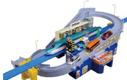
「トミカと遊ぼう！スーパーオートステーション」