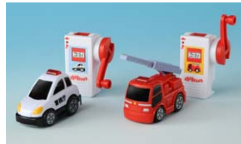
「ぐるぐるドライブ」