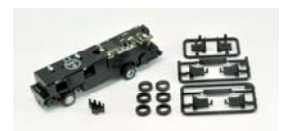
「BM-01バスコレ走行システム 専用動力ユニットA」 (株式会社トミーテック)