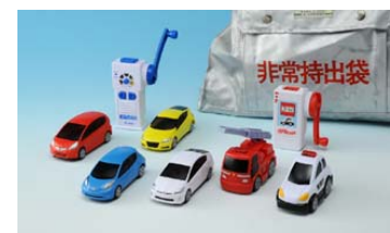
左4車種: 小学生向け「EDASH」

本商品は「EDASH」シリーズの一つで、他に「イノベティブ・Toy部門」優秀賞を受賞した小学生向けの「EDASH」と同時発売します。