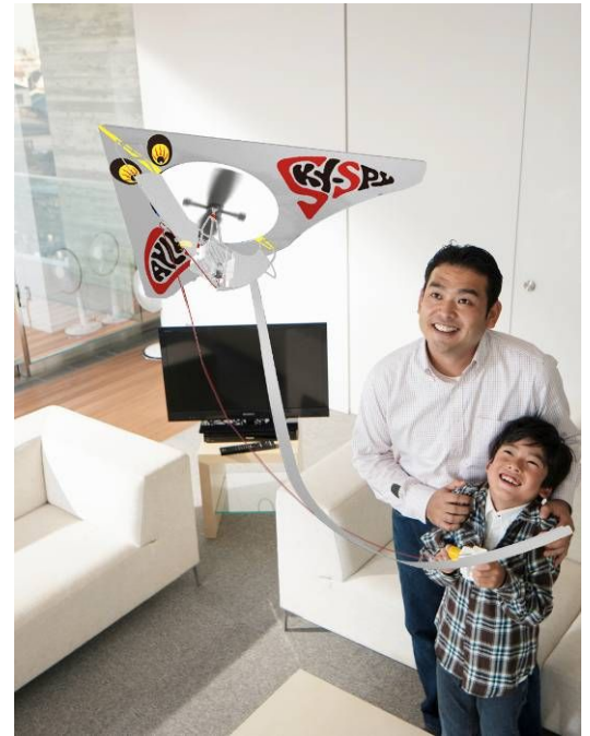
「ホームカイト」使用イメージ