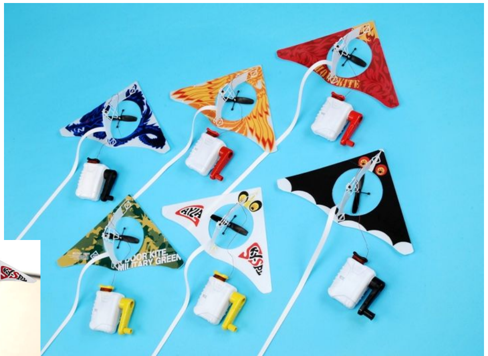
「ホームカイト」 希望小売価格 各2,940円(税込)／全6種 (左上からドラゴンブルー／フェニックスオレンジ／フレイムレッド 左下からミリタリーグリーン／ゲイラ・スカイスパイ／ゲイラベビーバット)