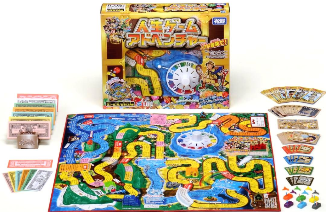
「人生ゲームアドベンチャー」(税込3,990円)