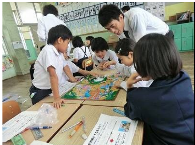
②与論島の「人生ゲーム」を製作する授業