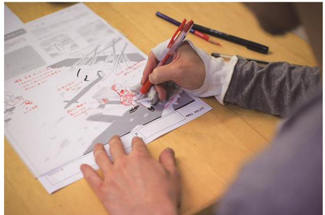
日本マンガ塾 添削イメージ