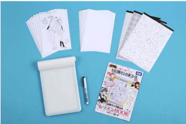
「14日間マンガ家コース」セット内容

商品名 : 「14日間マンガ家コース」 希望小売価格 : 4,500円 (税抜き) 発売日 : 2014年11月20日(木) 対象年齢 : 8歳以上 商品内容 : トレース台(1)、オリジナルトーン3種(各1)、レッスンブック(1)、お手本シート(8)、 添削サービス申し込みチケット(1)、添削応募シート2種(各2)、オリジナル原稿用紙(8)、 デリーター社製ミリペン(1)、 商品サイズ : トレース台:(W)180 × (H)25 × (D)280 mm 使用電池 : 単4形アルカリ乾電池×3(別売り) 販売目標 : 年間3万個 取扱い場所 : 全国の玩具専門店、百貨店・量販店等の玩具、インターネットショップ等 著作権表記 : (C) TOMY (C)Nihon Manga Juku ホームページ : http://www.takaratomy.co.jp/products/jobaca/manga/