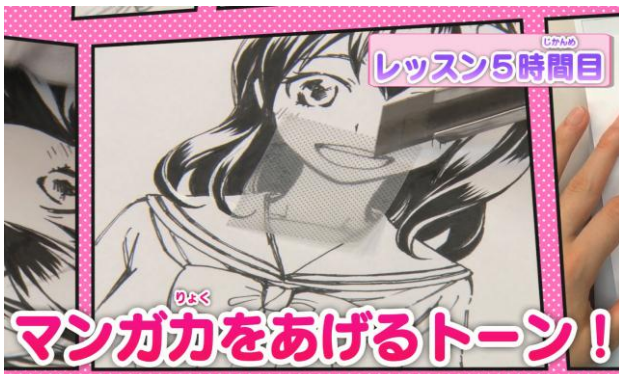
レッスン動画 イメージ