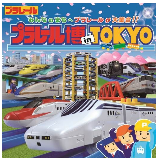
「プラレール博 in TOKYO」