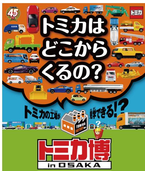
「トミカ博 in OSAKA」

今年のゴールデンウィークは大阪南港・ATCホールにて「トミカ博 in OSAKA」を4月25日(土)・26日(日)、4月29日(水・祝)～5月6日(水・振休)の10日間、千葉・幕張メッセにて「プラレール博 in TOKYO」を4月29日(水・祝)～5月6日(水・振休)の8日間、それぞれ開催いたします。