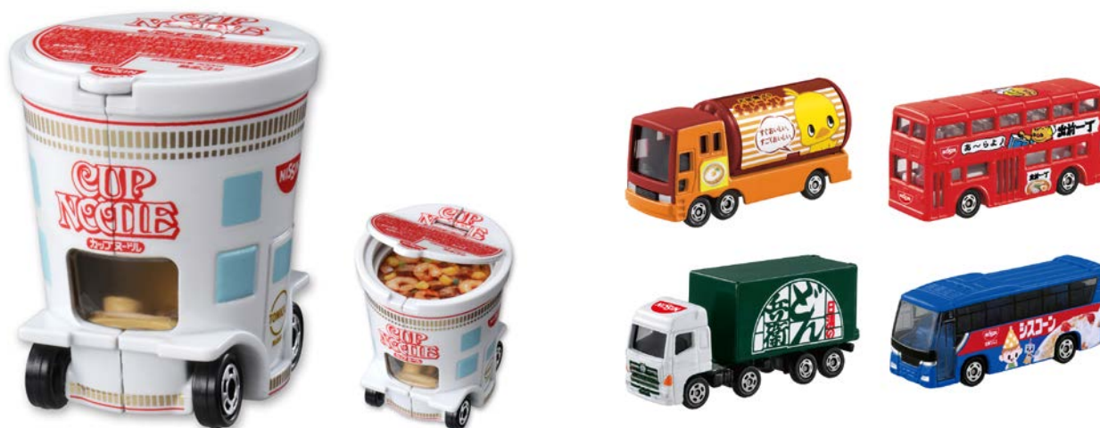
「ドリームトミカ 日清カップヌードル」

また、同時発売として、チキンラーメン、出前一丁、日清のどん兵衛、シスコーンという日清食品グループの4ブランドを車にラッピングした「トミカ」の4台セット「日清食品アドカーセット」(希望小売価格 2,000円/税抜き)を展開いたします。