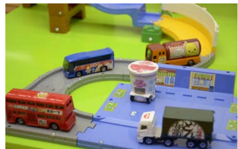
使用イメージ 「日清食品アドカーセット」「ドリームトミカ 日清カップヌードル」

トラックやバスに各ブランドそれぞれのロゴや特徴をラッピングした商品で、「ドリームトミカ 日清カップヌードル」同様に、トミカと同じ規格で作っているためコースの玩具等で遊ぶことも可能です。