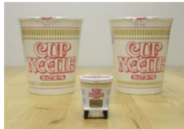
比較：(左)実物の約3分の1の大きさ (右)蓋の表記も実物に近く再現 ※蓋の比較は実際の比率とは異なります。

そのままデスクやテーブルに飾って楽しめるほか、トミカと規格を合わせて作っているため、トミカを走らせるコースの玩具「トミカワールド」や「トミカシステム」等で、通常のトミカと同じように遊ぶこともできます。