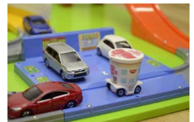
使用イメージ：「トミカ」としての遊びも可能