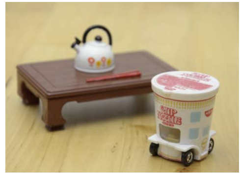
使用イメージ「ドリームトミカ 日清カップヌードル」

今回企画した「ドリームトミカ 日清カップヌードル」は、見た目はまるで本物の「カップヌードル」ながら、コンセプトや蓋開閉のワンアクションなど、おもちゃとしての遊び心も付加しました。