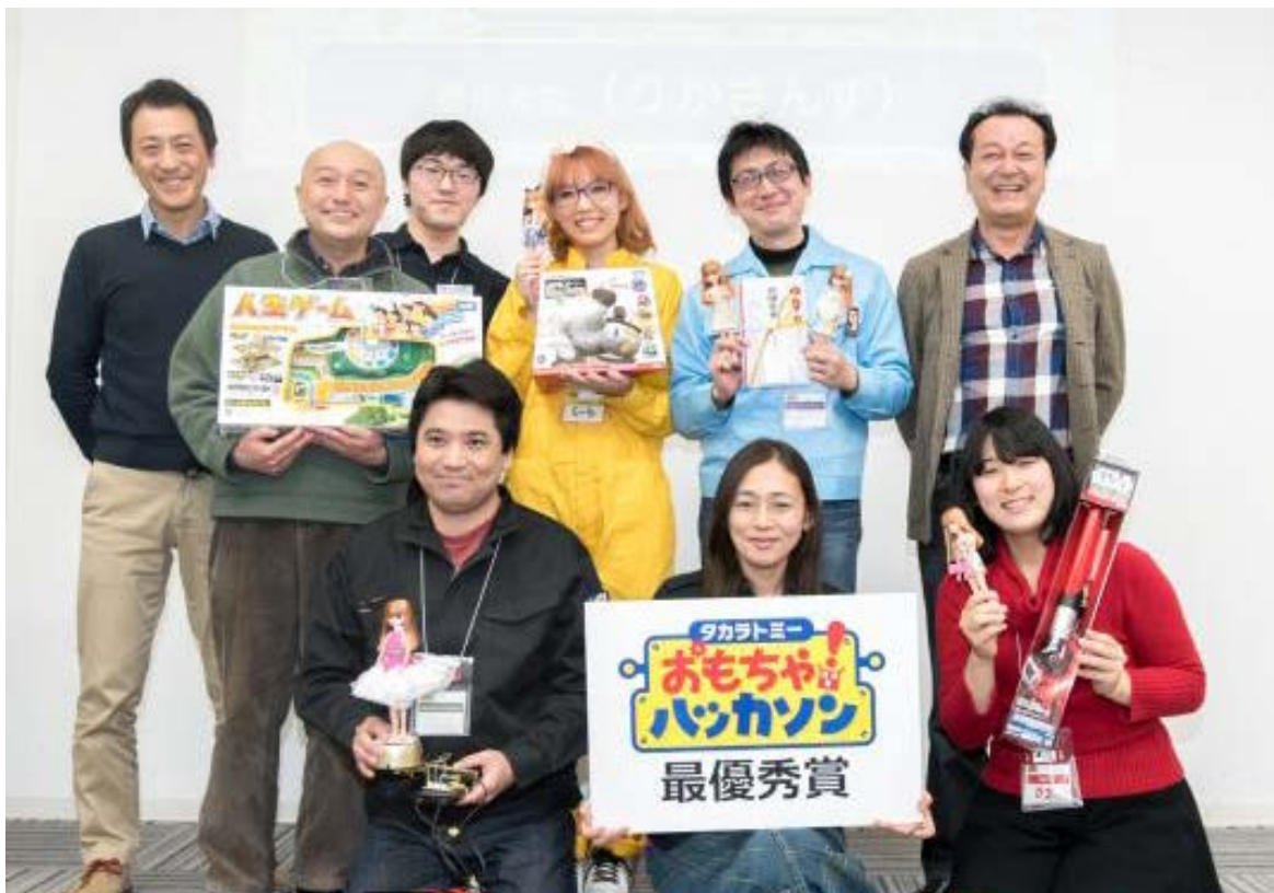
▲最優秀賞受賞チーム「りかさんず」と審査員