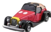
初代「ドリームスター」

5年後、「ドリームスターⅡ」はアメリカンラグジュアリータイプのデザインにフルモデルチェンジしました。