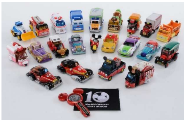
トミカ『ディズニーモーターズ』シリーズ

さらに、10周年を記念し、デビュー車から最新車まで230台以上を初めて一斉展示するなど、ここでしか見られない商品が盛りだくさんのイベント「D-MOTORS SQUARE」を7月11日（水）から24日（火）まで東京スカイツリータウン・ソラマチで開催します。