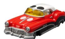
2代目「ドリームスターⅡ」

大人の女性向けモデル「ディズニーモーターズ ジュエリーウェイ」は、ジュエリーのようにキラキラな女の子たちの夢をそっとしまっておける車としてデザインしました。ジュエリーウェイは全部で5種類、すべての車の屋根などがジュエリーボックスのように開閉し、中に小物が収納できます。