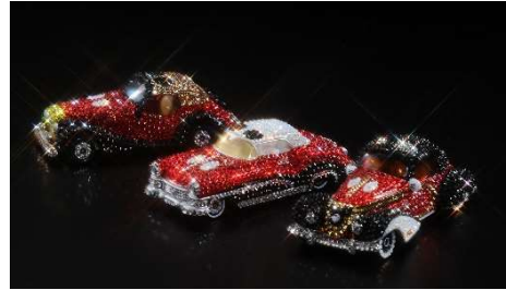
初展示!! スワロフスキー・クリスタルで飾られた初代から最新の「ドリームスター」※非売品