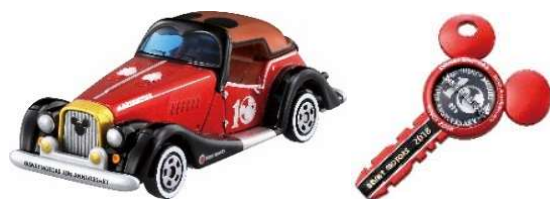
「ドリームスター ミッキー・マウス 10thアニバーサリーエディション」

「ドゥービー ミッキー・マウス 10thアニバーサリーエディション」は人気車種のドゥービーをポップコーンショップにしました。赤と金のカラーリングで豪華な車になっています。