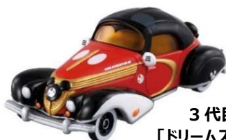
3代目フラッグシップカー 「ドリームスターⅢ ミッキー・マウス」