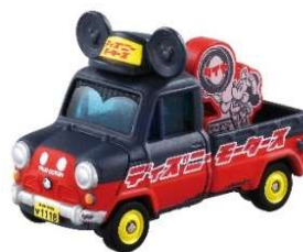
「ソラッタ ミッキー・マウス」