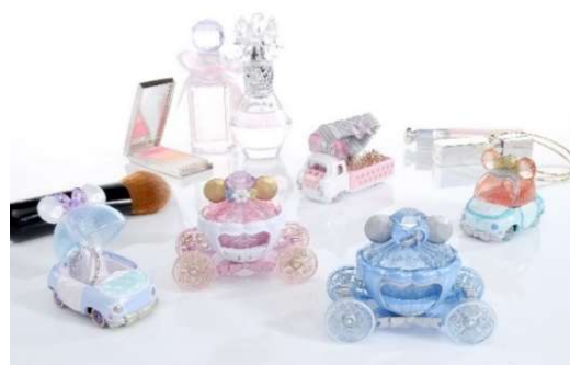
「ディズニーモーターズ ジュエリーウェイ」