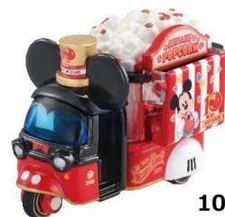
「ドゥービー ミッキー・マウス 10thアニバーサリーエディション」