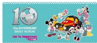
『ディズニーモーターズ』10周年ロゴ・キービジュアル