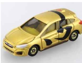
「心」 スバル インプレッサ スポーツ モデル