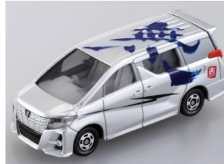
「無」 トヨタ アルファード