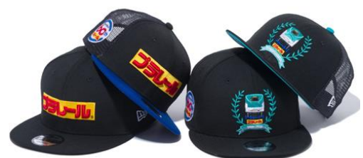
ニューエラ コラボレーションキャップ(2種×2サイズ) ※詳細は5ページ目参照

ショッピングゾーンでは、様々なイベント記念商品プラレール、お菓子や本、アパレルなど、プラレールのおもちゃやグッズを販売するほか、ニューエラから5月9日(木)に発売されるコラボレーションキャップを先行販売いたします。