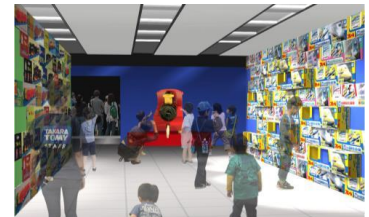
新旧のパッケージ展示(イメージ)

プラレールの歴史を商品展示と共にふりかえるコーナー、新旧のプラレール車両やパッケージを比較して楽しめるコーナーなど、親子で楽しみながらプラレールの歴史に触れられる展示を行います。