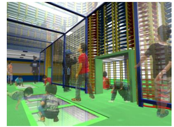
超デカッ！プラレールトンネル(イメージ)

さらに、お子さまがジオラマの中に入っている様に見える不思議な写真も撮影していただけます。