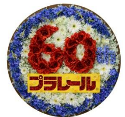
『おはなでできた60周年ロゴ』

同アート内には、10月で70周年を迎える日比谷花壇とのコラボレーションとして制作していただいた『おはなでできた60周年ロゴ』も合わせて展示いたします。