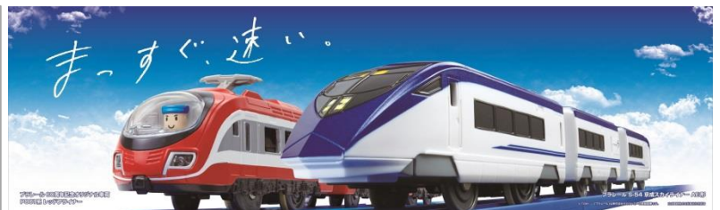
駅構内に展示されるコラボ路線図(左)、コラボビジュアル(上)