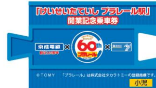
券面おもて面イメージ 左:大人用 / 右:小児用