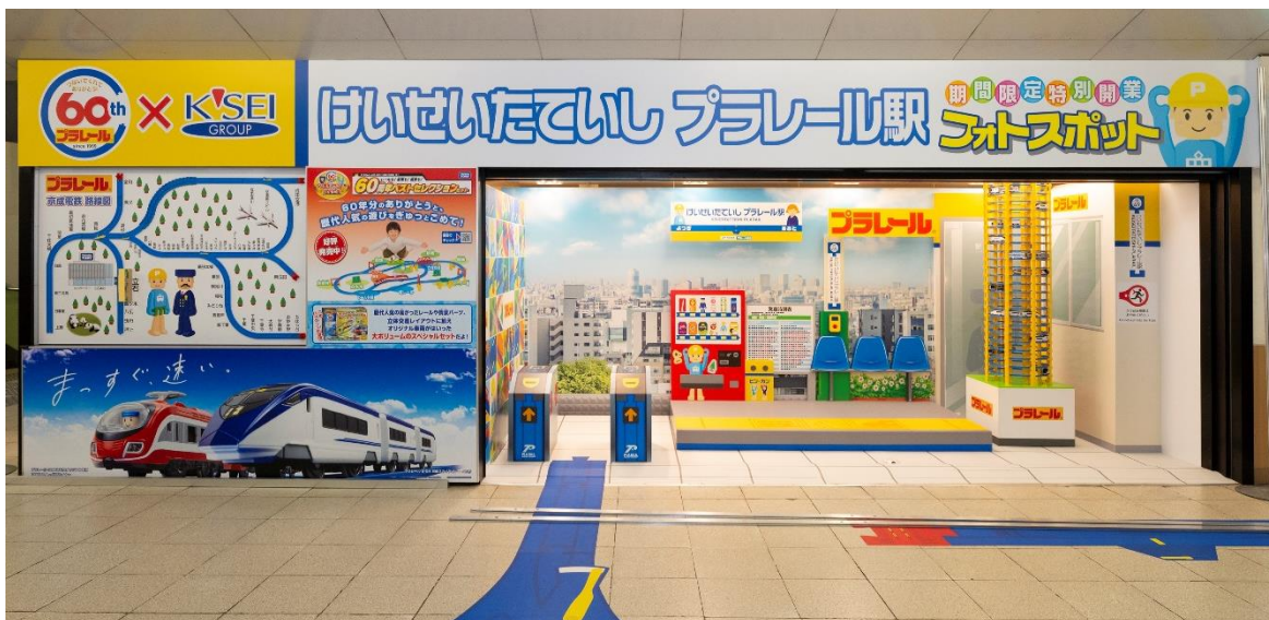
「けいせい たていしプラレール駅」