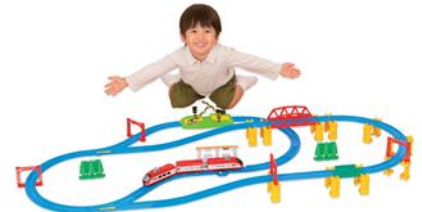
「ルールも！車両も！情景も！ 60周年 ベストセレクションセット」