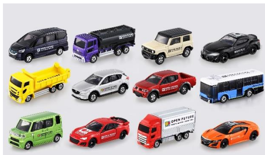
「2019東京モーターショー開催記念トミカ」

今年も、「トミカ」以外にも幅広いコンテンツを展開し、「リカちゃん」、「パウ・パトロール」、「ギガストリーム」、「トランスフォーマー」のコーナーも登場します。