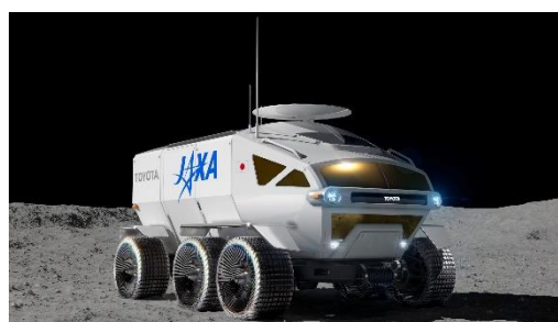
「トヨタ×JAXA 月面有人と圧ローバ」 (実車イメージ画像)

※1)「TOYOTA GAZOO Racing 86/BRZ Race 2019」に参戦中の「tomica ネット兵庫 86BS トヨタ 86」のトミカです。 ※2)トミカの架空の世界観で、「トミカタウン」、「トミカアドベンチャー」、「トミカスピードウェイ」、「トミカフューチャーシティ」など様々なテーマに合わせ、商品展開を行っています。