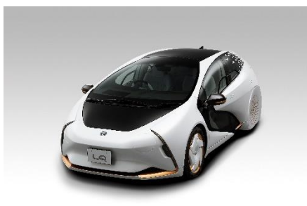
「TOYOTA LQ」 (実車画像)