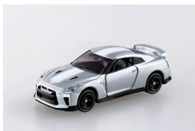
「日産 GT-R 50th Anniversary」 価格: 770円(税込み) ※会場先行発売

価格: <単品> 770円 (税込み) <12台セット> 9,240円 (税込み)