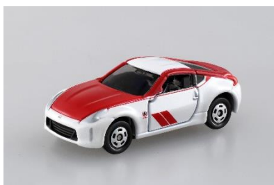
「日産 フェアレディ Z 50th Anniversary」 価格: 770円(税込み) ※会場先行発売