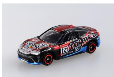
「tomica ネット兵庫 86BS トヨタ 86」 価格: 880円(税込み) ※会場先行発売