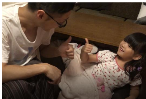
寝かしつけ大成功！

スーパーダディ達にご自宅で“お子さまと寝かしつけ”にチャレンジする様子を撮影していただきました。「ねんねさせてあげてね」、「お布団かけてあげようか」、「一緒に寝てみたら?」、「どうやったら目を閉じるかなー(眠ってくれるかなー)」、「眠そうだよー」、「あー起きちゃったね」などパパがお子さまに働きかけ、一緒に頭をなでたり、「シー！」と静かにしたりと親子でコミュニケーションを取りながら「寝かしつけ」を楽しむ姿が見られました。