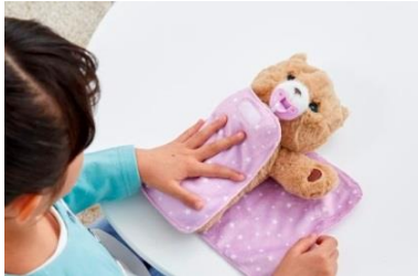
おねんねする前にブランケットにくるんであげてね

「だっこして ネルン」は、そっと寝かせてもすぐに眠るわけではなく、本物の赤ちゃんのように、眠ったと思ったらすぐに起きてしまうことも多くあります。「ネルンをおねんねさせてみようか?」、「ネルンはどうやったらおねんねするかな?」などお子さまに声を掛けながら一緒に遊んでください。眠ったと思ったら・・・まだ眠っていないなかったり・・・。「絵本を読む」、「子守唄を歌う」などお子さまはあの手この手で寝かしつけにチャレンジする楽しさがあります。また、一生懸命ネルンをお世話するお子さまの姿に親も愛おしさを感じるなど、親子で夢中になれるぬいぐるみです。