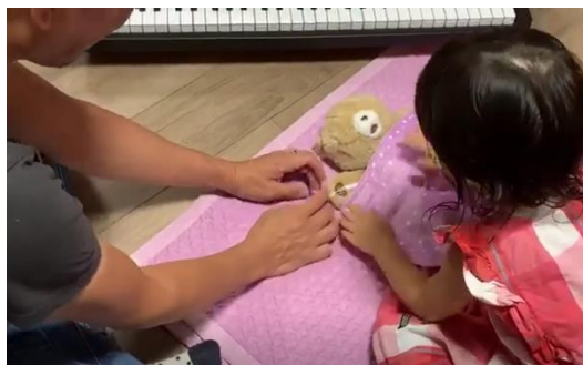
パパと一緒に寝かしつけにチャレンジ！