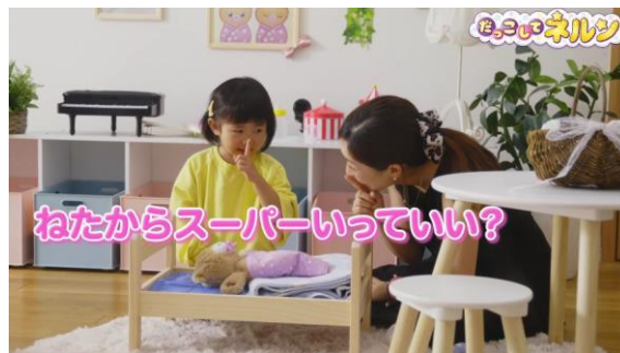
ママの真似っ子してみたり・・・