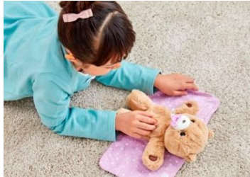
お腹をくすぐると楽しそうに笑うよ