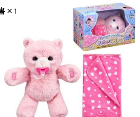
「だっこして ネルン ピーチベア」