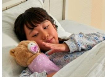
おしゃぶりを口に入れて、そっと寝かせてあげるとおねんねをはじめちゃう