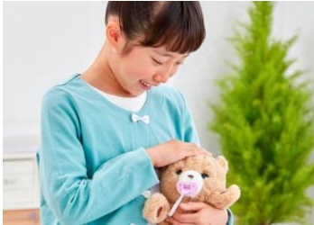
頭をなでなですると声を出してよこぶよ