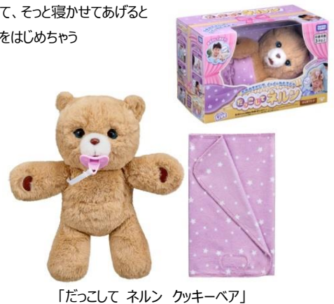
「だっこして ネルン クッキーベア」

ホームページ： www.takaratomy.co.jp/products/nerun/