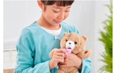
おしゃぶりをお口に入れるとちゅぼちゅぼするよ