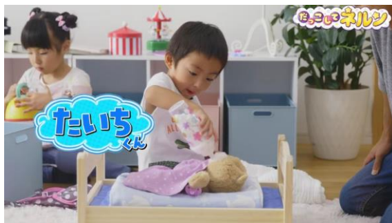
ミルクを飲ませてみたり・・・

お子さまが自由に遊ぶ姿を別室でモニタリングし、こっそりその様子を撮影しました。くすぐる、頭をなでる、ピアノを聞かせる、絵本を読み聞かせる、ミルクを飲ませる、ブラシで身体を梳かすなど、様々なお世話を楽しんでいました。「寝ているからシー！」とみんな静かにするように伝え、優しく「とんとん」寝かしつけしたり、「ネルン」が無事ねると「寝たからスーパー行っていい？」とママの真似をする子もいるなど、親になりきって「寝かしつけ」するほほえましい姿が見られました。