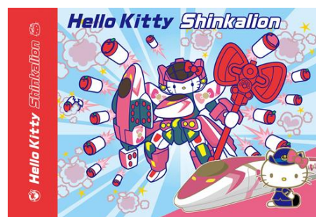
パッケージ裏に描かれたコラボイラスト