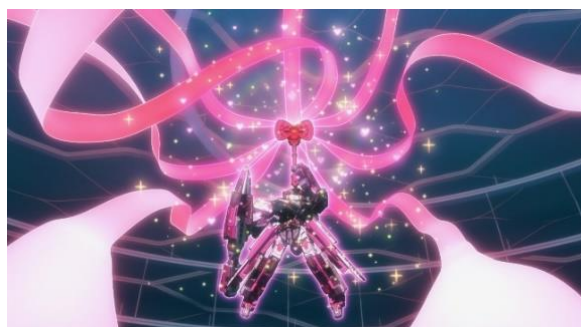
オリジナルコラボアニメーション 場面写真

また、「シンカリオン ハローキティ」は、“ハローキティマスク”をかぶった、カッコよくもキュートな“ハローキティモード”へのモードチェンジや、別売りのシンカリオンとの可愛いクロス合体も可能です。