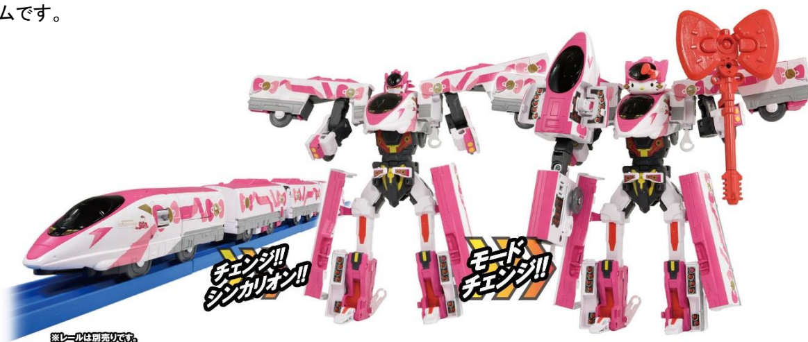
左から：シンカンセンモード、シンカリオンモード、ハローキティモード

ハローキティのフェイスがモチーフの“ハローキティマスク”をかぶせ、“リボンステッキ”を持たせると“ハローキティモード”になります。“リボンステッキ”は、細かいラメのあしらわれたリボン型ステッキで、作中では「一振りでその場にいるすべての人々を幸せにすることができる」という設定のハローキティらしいアイテムです。