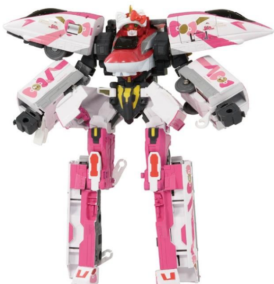
シンカリオン E 6こまちとの合体例

別売りのデラックスシンカリオンシリーズの先頭車(※)と“クロス合体”することで、全5両の車両から成る大型のシンカリオンにパワーアップします。クロス合体時には、ハローキティの耳とリボンをモチーフにした可愛いヘッドパーツ“ヘッドギア(シンカリオン ハローキティ仕様)”を装着させることで、合体後の姿をキュートに演出できます。