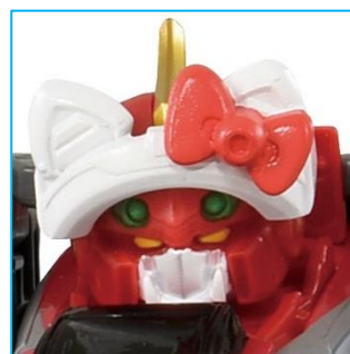
上：ヘッドギア (シンカリオン ハローキティ仕様)