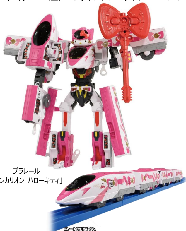
プラレール 「シンカリオン ハローキティ」