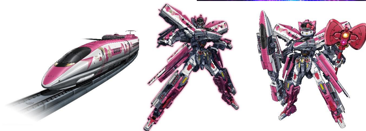
アニメーション内デザイン (左から: シンカンセンモード、シンカリオンモード、ハローキティモード)