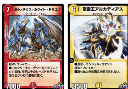
懐かしのレジェンド級カード (アプリ仕様) 左 : 「ボルメテウス・ホワイト・ドラゴン」 右 : 「聖霊王アルカディアス」