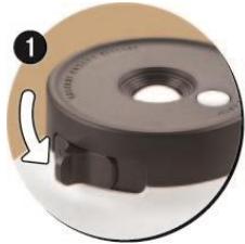
シャッターレバーを押し

レンズ横のシャッターレバーを押し、ハンドルを回すとフィルムがでてきます。付属のレンズキャップ(白飛びカットフィルター)は、快晴時の屋外撮影など、光の強い場所での撮影にもご利用いただけます。また、別売りのカラーフィルター(ショコラオレンジ・ベリーピンク・ミントグリーン)の3色セット)を装着することで、それぞれニュアンスの異なる写真を撮影することができます。