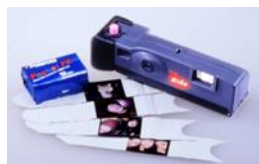
「ポラロイドポケット xiao(シャオ)」