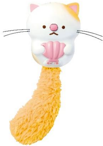
「うたって♪にゃっこアイランド」 みけにゃっこ

商品サイズ : (W)680mm × (H)800mm × (D)500mm 重量 : 約72g 販売目標 : 年間5万個 取扱い場所 : 全国の玩具専門店、百貨店・量販店等の玩具売場、インターネットショップ、一部の書店、タカラトミーの公式ショッピングサイト「タカラトミーモール」 takaratomy.com 等 著作権表記 : © TOMY ©2020 San-X Co., Ltd. All Rights Reserved. 公式HP : www.takaratomy.co.jp/products/nyakkoisland