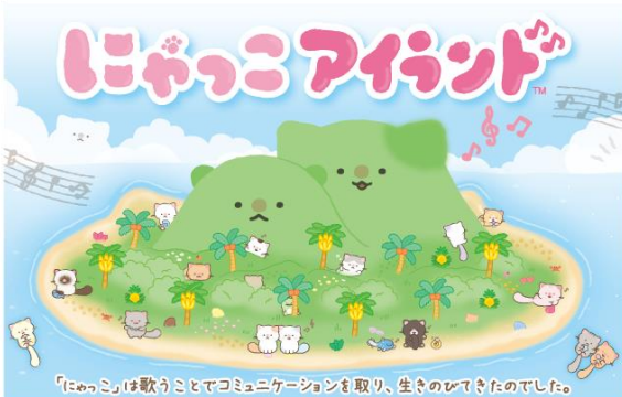
「にゃっこアイランド」

むかしむかし、歌うことが大好きな「にゃっこ」という生き物がいました。絶滅したと思われていた「にゃっこ」ですが、ある島で発見されたのです。その名も「にゃっこアイランド」。「にゃっこ」たちは、歌うことによってコミュニケーションを取り、にゃんとか生き延びてきたようです。