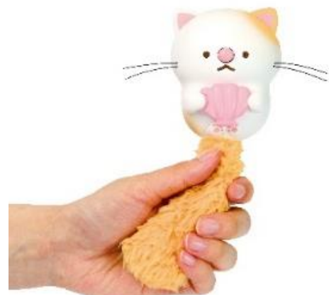
キャラクター「にゃっこアイランド」