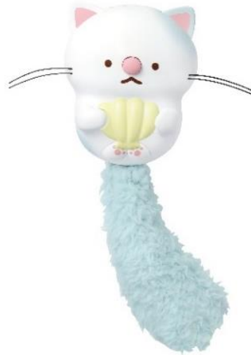
「うたって♪にゃっこアイランド」 そらにゃっこ