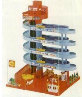
1972年 「トミカビルデラックス」

立体駐車場をイメージし、「トミカ」をスロープで走らせたり、駐車場に飾ったり、給油ごっこをしたりと、「トミカ」遊びでの想像の世界を広げる商品として登場。エレベーターは手動で1台ずつ屋上に運ぶ仕組み