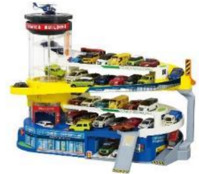
2020年 「ダブルアクショントミカビル」

「トミカ」40周年で大幅リニューアル。最大5台の「トミカ」が同時に乗る電動のスパイラルエレベーターを採用。電動・手動どちらでも遊ぶことができ、「トミカ」を自動で走らせ続けたり、「トミカワールド」の一部と連結できる