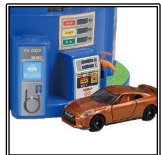
給油などのごっこ遊び