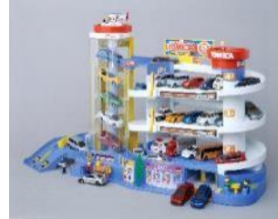
2010年 「スーパーオートトミカビル」

「トミカビル」発売の翌年に登場。通常の「トミカビル」から2フロア増えて5階建てになりレベーターで「トミカ」を一気に屋上まで運べるようになった、まさに“デラックス”なビル。