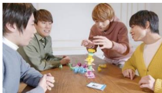
QuizKnockのメンバーが商品で遊ぶ様子

本商品を企画するにあたり、エンタメと知を融合したメディア「QuizKnock」の「楽しいから始まる学び」というコンセプトに共鳴し、監修をいただくことになりました。各ゲームのルールやゲームバランスの調整、使用する能力などの設定にあたり、「QuizKnock」のメンバーの“東大脳”を存分に発揮していただきました。