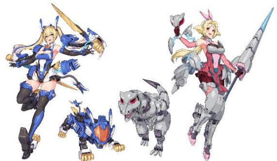
「メタモルバース」イメージイラスト