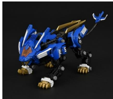
左) 「RMZ-01 ブレードライガー」

発売日： 2025年 予約受付開始： 2024年夏 希望小売価格： 未定 著作権表記： © TOMY © ShoPro