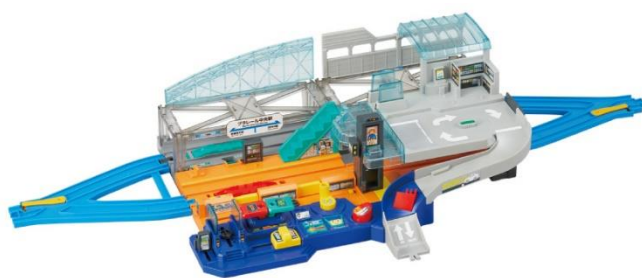
Y字ポイントレールが付属！

「Y字ポイントレール」（A・B各1本）が付属し、お手持ちの「直線レール」と「曲線レール」を組み合わせるだけで簡単にレイアウトを作って遊ぶことができます。さらに駅の2階部分にレール置けば、高架駅として楽しむことも可能です。そのほか、連結車両が収まるロングステーションに変形するなど自由な発想で自分だけの駅を作ることができます。