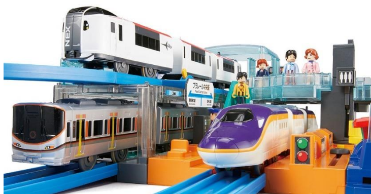
高架駅で3路線の入線を楽しもう！