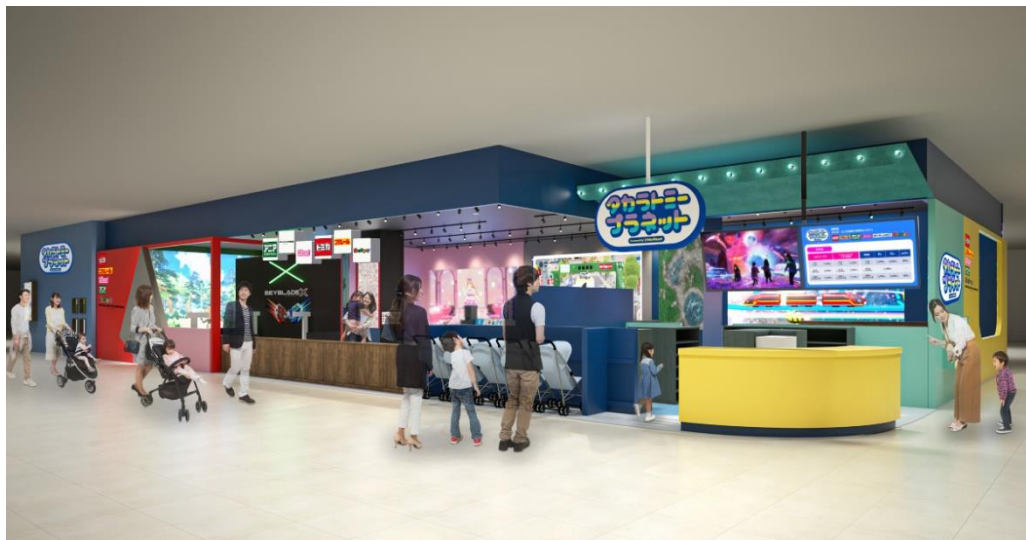
「タカトミープラネット イトーヨーカドーアリオ亀有」外観イメージ

※XR（Extended Reality）…現実世界と仮想世界を融合する技術の総称