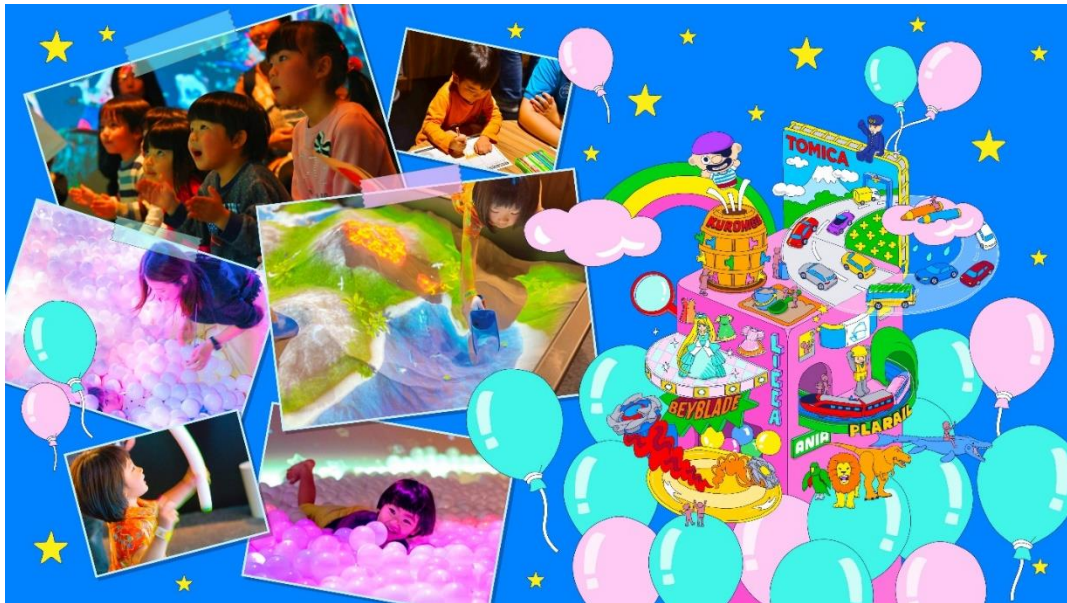
「タカラトミープラネット」イメージビジュアル

ダイキャスト製ミニカー「トミカ」がデジタルで3Dとなって登場し、白熱のレースを繰り広げる「トミカ デザインレーシング」、鉄道玩具「プラレール」が広大な海や宇宙空間を走る「プラレール ファンタジーワールド」、着せ替え人形「リカちゃん」の衣装を自由にデザインしてスクリーン上でファッションショーに参加できる「リカちゃん おえかきデザインコレクション」、現代版ベーゴマ「ベイブレード」のバトルをリアルタイムにショーアップするデジタルスタジアム筐体「ベイブレードXRスタジアム」、手のひらサイズの動かして遊べる動物フィギュア「アニア」の世界とプロジェクションマッピングが融合した次世代ボールプール「冒険！アニアキングダム」など、世界中で愛されるタカラトミーのおもちゃをテーマにした計8種の体験型アトラクションを、三世代で一緒にお楽しみいただけます。