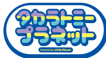
「タカラトミープラネット」ロゴ

店舗名称 : 「タカラトミープラネット イトヨーカドーアリオ亀有」 オープン日 : 2024年11月22日（金） 営業時間 : 10：00～21：00 所在地 : 東京都葛飾区亀有3丁目49-3 アリオ亀有3F 面積 : 約100坪 料金 : 子ども（2～17歳）平日：30分800円～、1日フリーパス2,500円 休日：30分1,000円～、1日フリーパス3,200円 おとな（18歳以上）平日800円、休日1,000円（延長料金なし） ※料金の詳細は11月以降に公式サイトにて公開予定 公式サイト : https://litpla.com/takaratomyplanet/ 著作権表記 : © T O M Y © Litpla Inc. © Ito-Yokado Co., Ltd. All rights reserved. ※「ベイブレードXRスタジアム / BEYBLADE XR STADIUM」については以下 © Homura Kawamoto, Hikaru Muno, Posuka Demizu, BBXProject, TV TOKYO © T O M Y © Litpla Inc. © Ito-Yokado Co., Ltd. All rights reserved. 企画・制作 : 株式会社タカラトミー、株式会社リトプラ 店舗運営 : 株式会社イトヨーカ堂