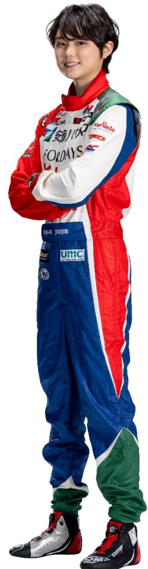
Juju選手(レーシングスーツ左腕のTOMICAロゴ)