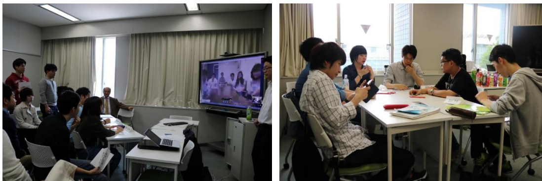
（左）通信サービス「Skype（スカイプ）」を利用した泰日工業大学との合同授業。（右）5月には泰日工業大学の学生が来日し、直接対話による合同授業も実現しました。

その後5月9日（月）から30日（月）までの間、泰日工業大学の学生が日本に滞在し、本学学生と「日本のお茶飲料をタイでいかに売るか」とうテーマで合同研究を行い、飲料メーカーや大手スーパー、地元の茶畑・製茶工場などを訪問し研究を深めました。8月には本学の学生がタイを訪問し、現地調査を実施する予定です。