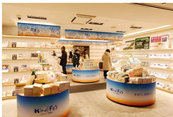
店内もフェス仕様に（1階 THE ENTRANCE）