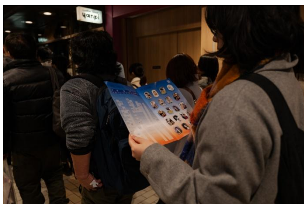
開場を待つ参加者