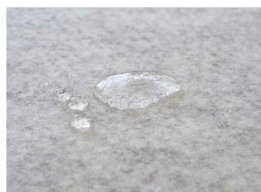
撥水クッション層