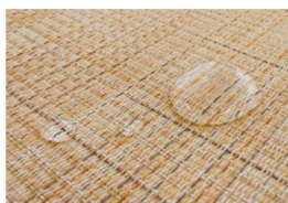
特殊コーティング、抗菌・防カビ加工

表面材の塩ビ被覆系織物には、特殊コーティング、抗菌・防カビ加工を施しています。撥水・撥油性があるので、汚れがつきにくく、水廻りなど衛生面が気になる場所にも安心です。