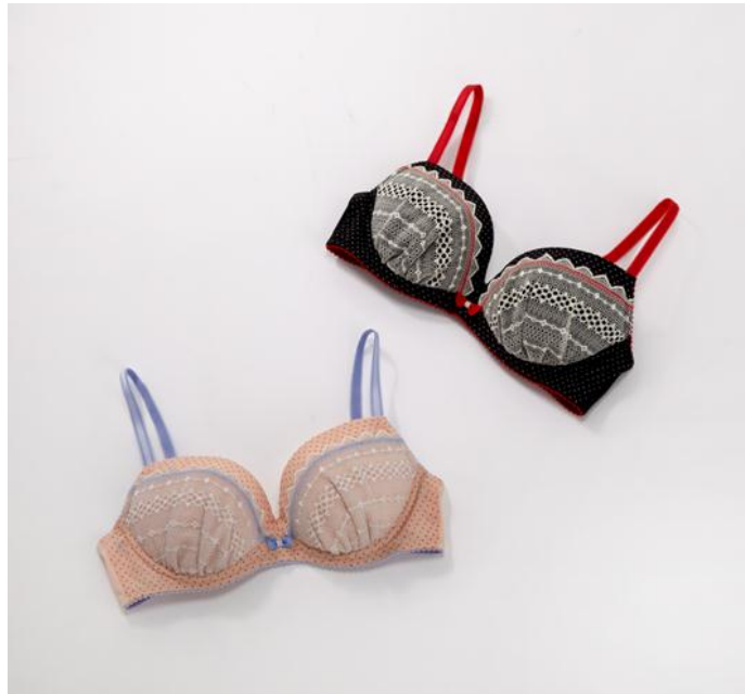
写真：『グミブラ』 JB2600（カラー：パープル、ブラック）

『グミブラ』は2月初旬より全国の「ウンナナクール」直営店42店舗、およびZozotown、ワコールウェブストアで販売し、シリーズ2品番で13,000枚の売上を目指します。（2013年2月～6月）