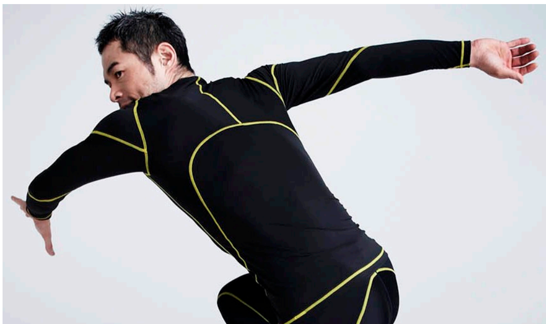
着用商品 『CW-X STYLE FREE TOP』VAO・002 カラー:YE(イエロー)

全国百貨店のスポーツ売場やスポーツチェーン店、スポーツ専門店、「CW-X」コンディショニングストア、ワコールウェブストアで発売し、5万枚の売上を目指します。(2013年2月～7月)