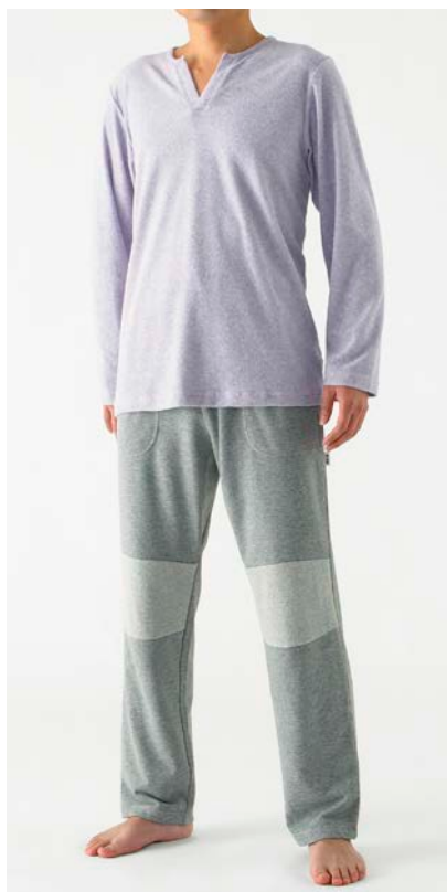
写真の商品：トップ EG-7001 (カラー：パープル) / ボトム EI-7004 (カラー：グレー)

全国のチェーンストア(量販店)、ワコールウェブストアで発売し、初年度15,000枚の売上を目指します。(2013年2月～2014年3月)