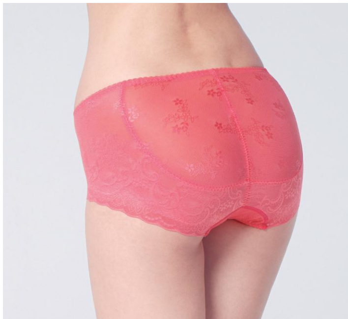
『すそピタショーツ 小尻ラクアップ』PPB・510

『すそピタショーツ』は、新タイプの『小尻ラクアップ』をはじめ、デザイン・カラーのバリエーションを増やし、ワコールの“機能性ショーツ”というカテゴリーの確立とともにさらなる売上げ拡大を目指します。また6月27日からは、一部地域でテレビCMの放送を開始します。