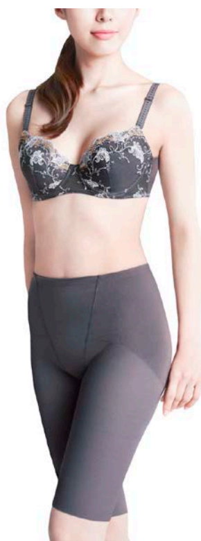
写真の商品：『なめらか腰パンツ』NQ-0731、 組み合わせのブラジャー『なめらか背中ブラ』NB-2731（カラー：チャコールグレー）

『なめらか腰パンツ』は全国のチェーンストア（量販店）、ワコールウェブストアで発売し、4万枚の売上を目指します。（2013年7月～12月）