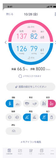
「かんたん血压日記」血压日記画面