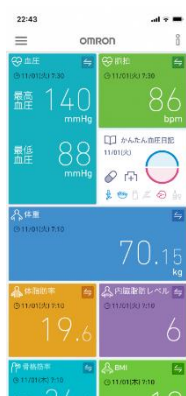
オムロンコネクト ホーム画面

*1 体重や歩数データ表示は、通信機能付き体重体組成計・体重計・活動量計が登録されている場合のみ