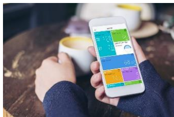
アプリ使用イメージ

オムロンコネクトは、Bluetooth 通信や音波通信でスマートフォンにバイタルデータを転送する無料のアプリケーションです。当社の通信機能付き健康機器で測定した血圧や体重、体温などのデータをグラフやカレンダーで管理することができます。血圧計（上腕式・手首式）、体重体組成計、活動量計、婦人用電子体温計・体温計、パルスオキシメータ、心電計に対応しています。