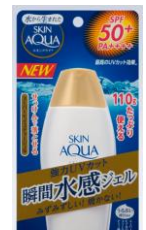
スキンアクア® スーパーモイスチャージェル

水のように気持ちいい使用感で、うるおいを与えながら紫外線をしっかりとカットする日焼け止め「スキンアクア®」シリーズは2006年に発売し、今年で12年目となりました。近年特にお客様から支持を得ているのが「スキンアクア®スーパーモイスチャージェル」です。