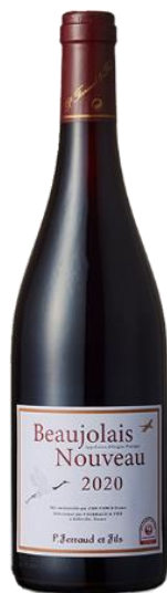
ボジョレー・ヌーヴォー JAL ショッピングオリジナルラベル