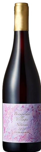
ボジョレー・ヴィラージュ・ヌーヴォー JALUX WINE+ART オリジナルラベル

11月19日(木)は、新酒のワインと共に、祝祭のような嬉しさと幸せを感じられる充実した時間をお楽しみください。