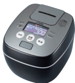
ラスターブラック〈KL〉