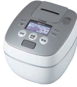
ラスターホワイト〈WL〉