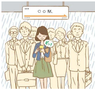
突然の雨や、寒い季節の帰宅時に