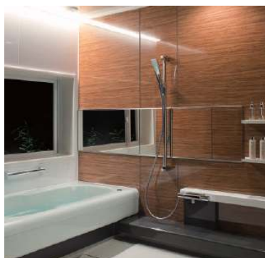
1. トクラスバスルーム (画像はストーリーです)