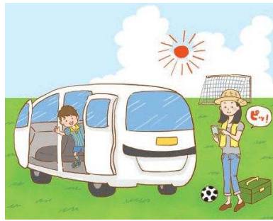
炎天下で1日、お子様のサッカー応援の後に