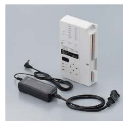
3. デンソーマルチコントローラ