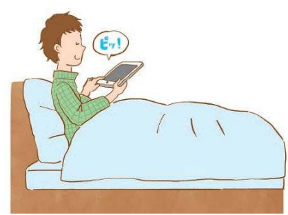
ゆっくり起きて朝風呂を楽しみたい週末に