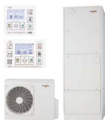
2. トクラスエコキュート