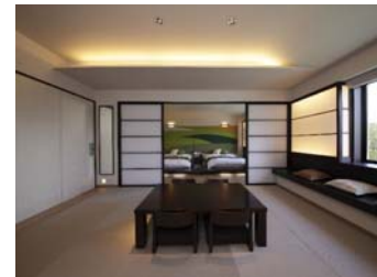
「フォレストスイート」