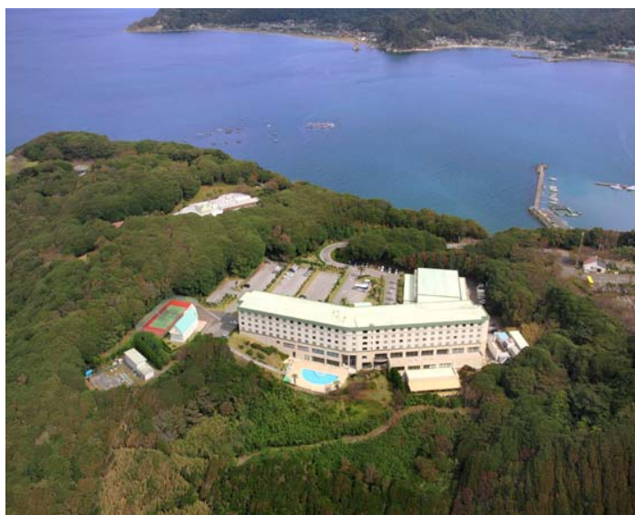
南房総富浦ロイヤルホテル 全景