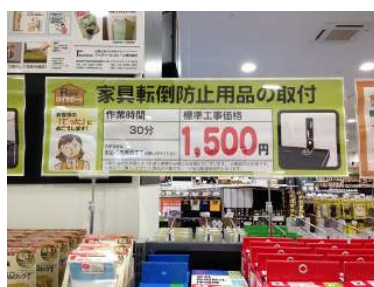
家具転倒防止用品の 取り付け代行サービス