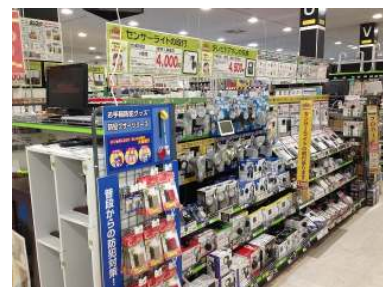
防犯用品コーナー