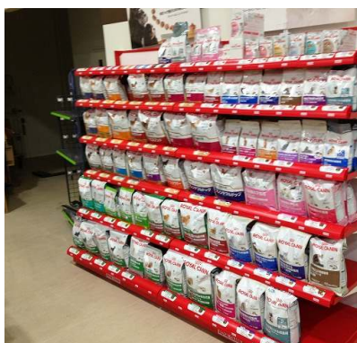
プレミアムフード