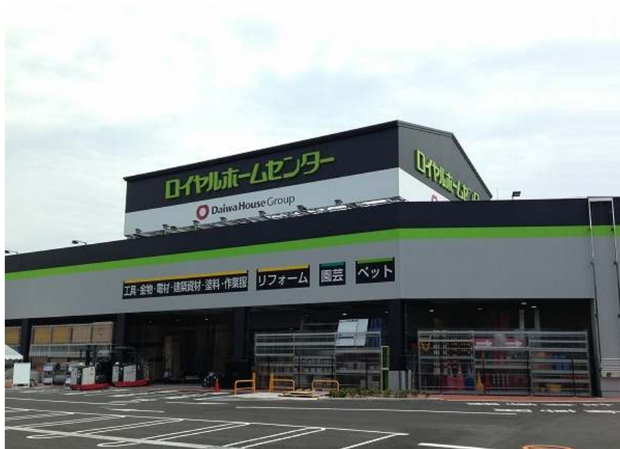
ロイヤルホームセンター東灘魚崎店