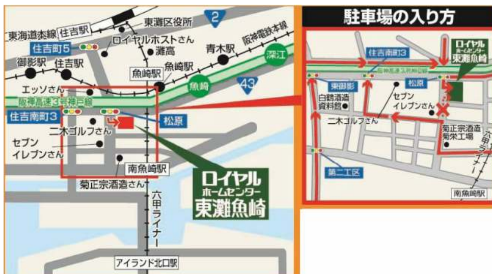
ロイヤルホームセンター東灘魚崎店周辺地図