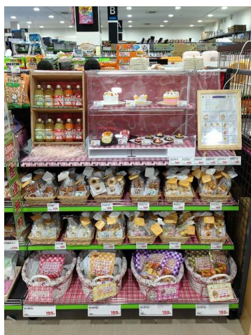
ケーキ・おやつコーナー

また、犬や猫以外にも、昆虫やは虫類など、初めて飼育されるお客さまから多頭飼育者まで楽しめる商品をご用意しています。