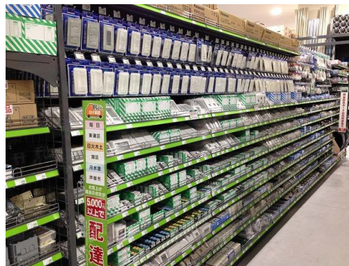
種類・在庫量共に充実の電設資材