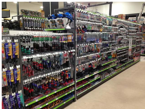
豊富な品揃えの作業工具

当店では、建築関連に従事される大工や塗装工、設備業の専門職人さま向けの建築資材や工具を豊富に取りそろえ、プロのお客さまの倉庫代わりの店として利用できるようにしました。特に、電動工具、作業工具、作業用品、電設資材の品ぞろえを充実させています。