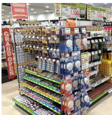
防災用品コーナー

※3.お客さまに代わってお買い上げ商品の取り付け、交換を行う当社有料サービスのこと。