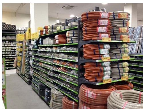
エアコン工事資材