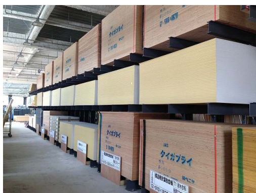
豊富な在庫量の建築資材

また、8月17日からは営業開始時間を早朝6時30分に変更し、現場に出向く前に資材・材料をお買い上げいただけるようになります。