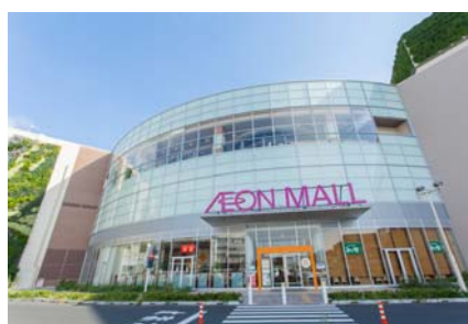
「イオンモール東久留米」