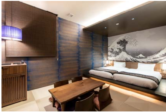
【浮世絵：デラックスツイン】