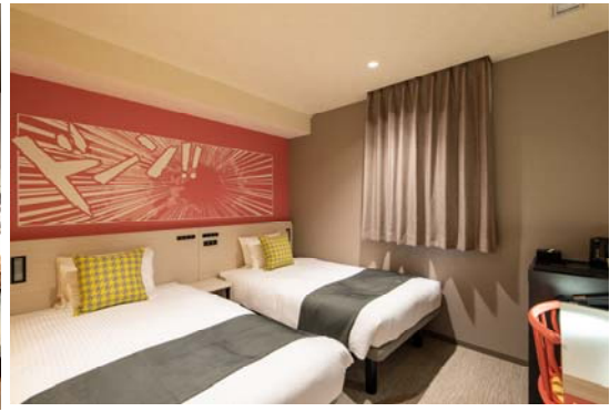
【マンガ：モデレートツイン】