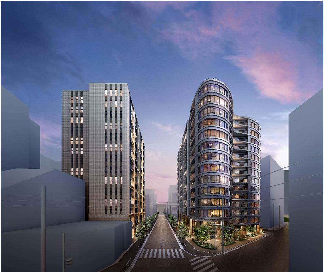
【「プレミスト東銀座築地 Arc Court / Edge Court」完成予想パース】