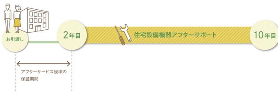
【「D's 10年サポート」イメージ図】

※1.対象エリアは全国。2020年4月以降の着工物件より導入を開始します。物件により実施しない場合があります。