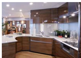
【システムキッチン】