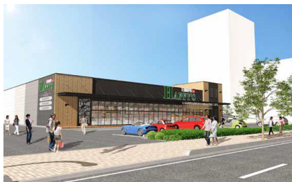
【天満屋ハピーズ昭和町店】

周辺施設には、「イオンモール岡山」(徒歩5分)や「奉還町商店街」(徒歩10分)などがあり、生活利便性が高い立地にあります。また、「厳井東公園」(隣接)や「岡山市立石井幼稚園」(徒歩6分)や「岡山市立石井小学校」(徒歩7分)、「済生会病院」(徒歩17分)など医療・教育施設、公園なども充実しています。