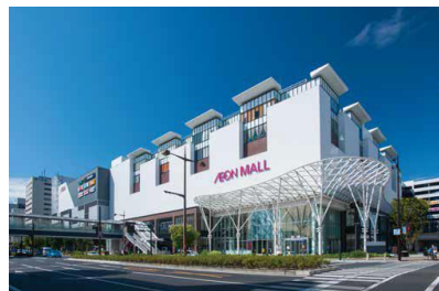
【イオンモール岡山】