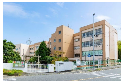
川崎市立宮崎台小学校