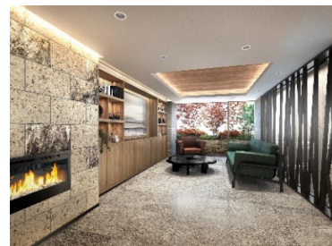
【ラウンジ（イメージ）】

あわせて、一部住戸には、仕事や趣味のスペースとして活用できる「マルチデスクカウンター」を窓際に設置。折りたたみできるため、使用しない際は収納できます。