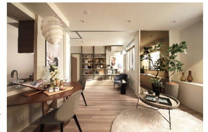
【「プレミスト宮崎台 RISE TERRACE」外観・内観イメージ】

「プレミスト宮崎台 RISE TERRACE」は、東急田園都市線「宮崎台駅」徒歩7分の閑静な住宅地が広がる高台に位置し、周辺には、公園や公共施設、文化・スポーツ施設などが充実しています。また、「宮崎台駅」前を中心に、スーパーマーケットや医療施設、飲食店などが点在し、自然環境と生活利便施設が備わっています。