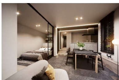
【天井高3mで開放感のあるLDK】