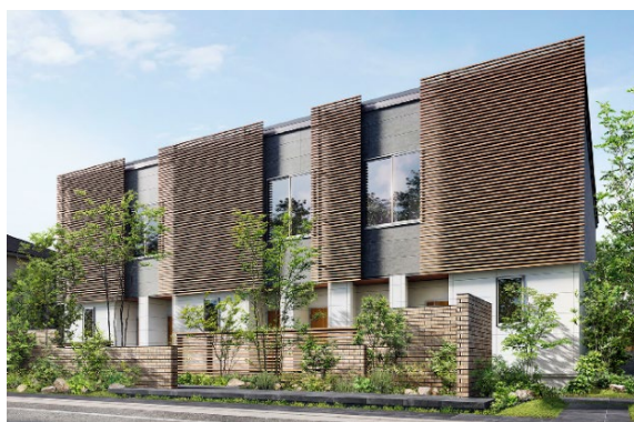
【オリジナルルーバー】

外観デザインは、都市型の「アーバンスタイル」、通常の「スタンダードスタイル」、シンプルな「カジュアルスタイル」の3タイプで展開します。また、外装材には地産材を活用したオリジナルルーバーを使用。外構には、環境に配慮するとともに建物の外観と調和する植栽プランを採用しました。