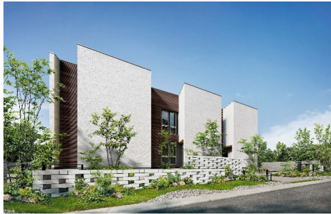
【「MOKURIE（モクリエ）」外観イメージ】

大和ハウス工業株式会社（本社：大阪市、社長：大友 浩嗣）は、2026年5月11日より、木造賃貸住宅商品「MOKURIE（モクリエ）」の全国展開を開始します。*1