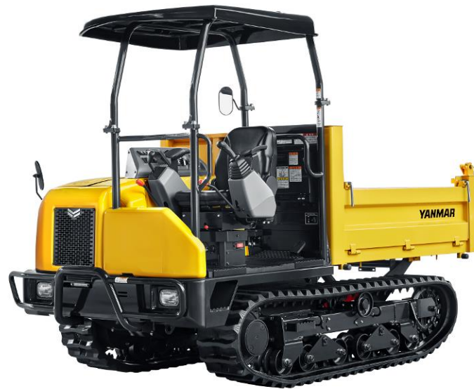
<クローラキャリア C30R-3（三方開きベッセル仕様）>

ヤンマー建機株式会社（本社：福岡県筑後市、社長：瀬戸智行）は、直感的な操作性と高い環境性能を実現したクローラキャリア「C30R-3（三方開きベッセル仕様）」を3月下旬より販売開始します。また今回新たに、ベッセル（荷箱）が旋回でき本機の側面でのダンプ作業を可能にした「C30R-3（180°旋回ベッセル仕様）」のラインアップを追加し、6月より販売開始します。