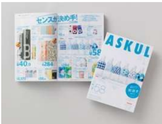
「アスクルカタログ 2014 春・夏号」 (有効期限：2014 年 9 月 30 日午後 6 時)

なおアスクル・インターネットショップは常に税込み価格を表示し、商品詳細ページには税抜き価格も表示します。詳しくは、 http://www.askul.co.jp/shopnews/news_tax_140220.html を参照ください。