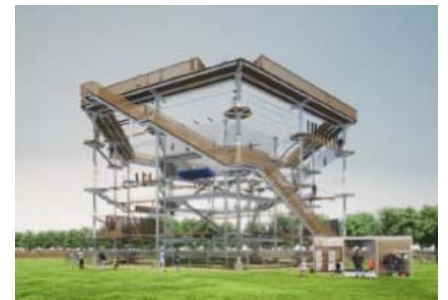
▲アスレチックタワー イメージ

博多湾を一望できる立地を生かして、子どもから大人まで楽しめる大型アスレチックタワーを新設します。ドイツ製の本施設は3層高さ約17mと九州で最大級の規模を誇り、かつ自然に調和したデザインです。遊びを通じた運動能力の向上や家族間やグループ間の会話が生まれ、コミュニケーション向上も図れると好評の施設です。