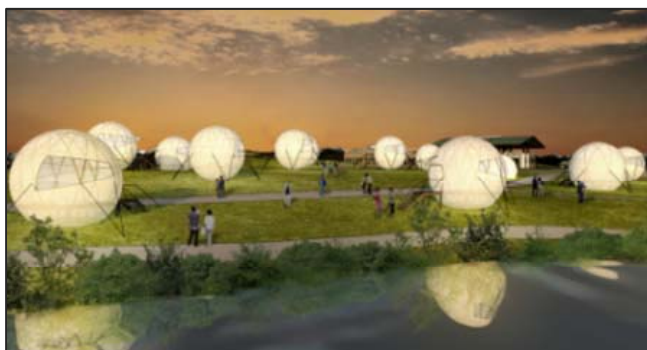
▲カモ池のロケーションを活かした球体テントを整備