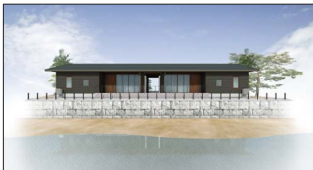
▲博多湾を一望できる宿泊施設「ヴィラ」