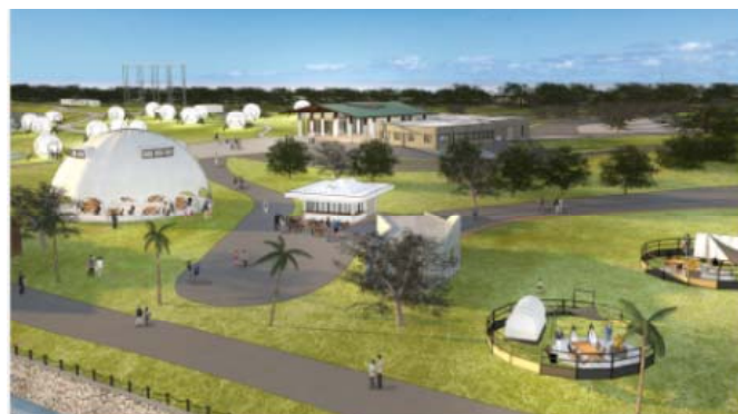
▲滞在型レクリエーション拠点 イメージ