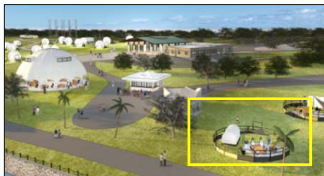
▲自然との一体感を味わえるアウトドアリビング (右下 黄色枠)