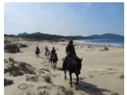
▲ホーストレッキング イメージ

玄界灘海浜部にみられる白砂青松と青い海、志賀島方面につづく細長い地形が特徴的な“海の中道”を堪能するホーストレッキングを提供します。