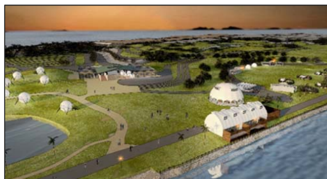
▲海風と緑に囲まれた開放的な宿泊エリア