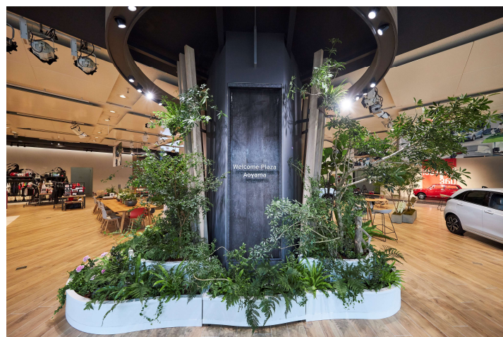
内装・ワイガヤの木

内装は、「再び訪れたくなる場」をコンセプトに、ウッドとグリーンを多く取り入れ、親しみやすく居心地の良い空間としました。メインエントランスでは Honda 事業所がある世界各国の植栽を用いた「ワイガヤ ※3 の木」がお客様をお迎えします。「ワイガヤの木」は、種類の異なる木が根をはり合うことでお互いがより強くなるという考え方から、自由に意見を出し合うことによる多様性を表現しました。植栽と水の演出には、株式会社パーク・コーポレーションの parkERs がプロデュースを手がけ、自然の中にあるようなリラックスできる空間を演出します。