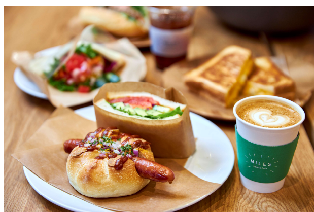
MILES Honda Cafe イメージ